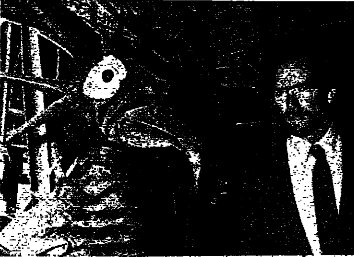
كليت في السينماتيك الباريسية